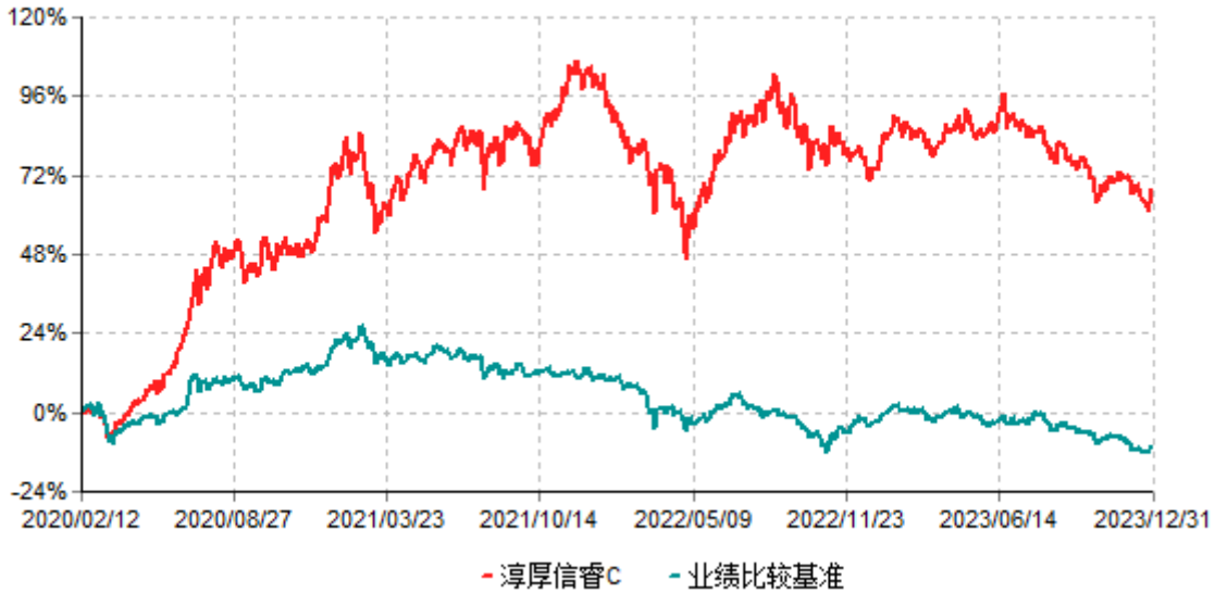
淳厚信睿C累计净值增长率与业绩比较基准收益率历史走势对比图 (2020年02月12日-2023年12月31日)

注：本基金基金合同生效日为2020年2月12日。按基金合同约定，本基金自基金合同生效起6个月内为建仓期。建仓期结束时本基金的各项投资比例均符合基金合同约定。