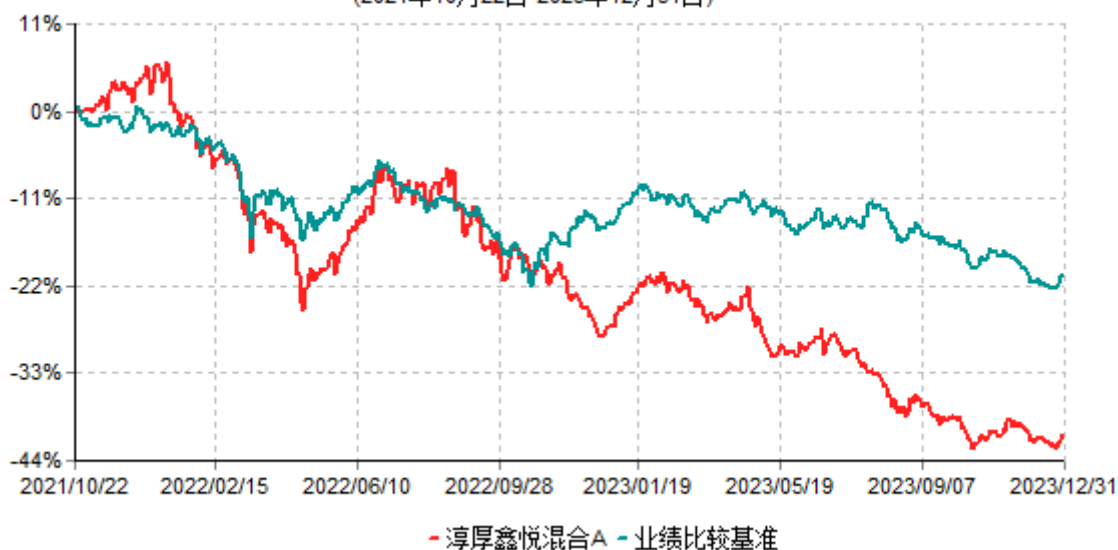
淳厚鑫悦混合A累计净值增长率与业绩比较基准收益率历史走势对比图 (2021年10月22日-2023年12月31日)

注：本基金基金合同生效日为2021年10月22日。按基金合同规定，本基金自基金合同生效起6个月内为建仓期。建仓期结束时本基金的各项投资比例均符合基金合同约定。