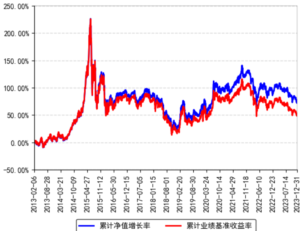
南方中证500ETF累计净值增长率与同期业绩比较基准收益率的历史走势对比图