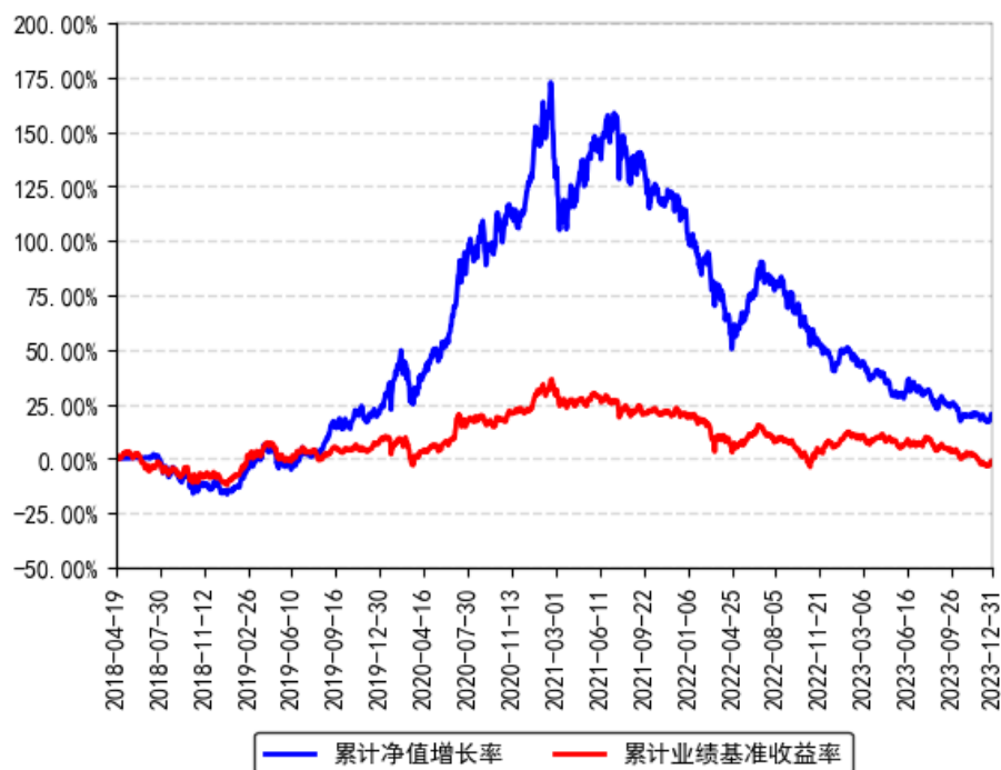
南方成安优选灵活配置混合累计净值增长率与同期业绩比较基准收益率的历史走势对比图