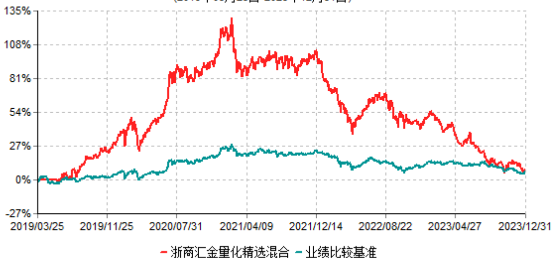
浙商汇金量化精选灵活配置混合型证券投资基金累计净值增长率与业绩比较基准收益率历史 走势对比图 (2019年03月25日-2023年12月31日)