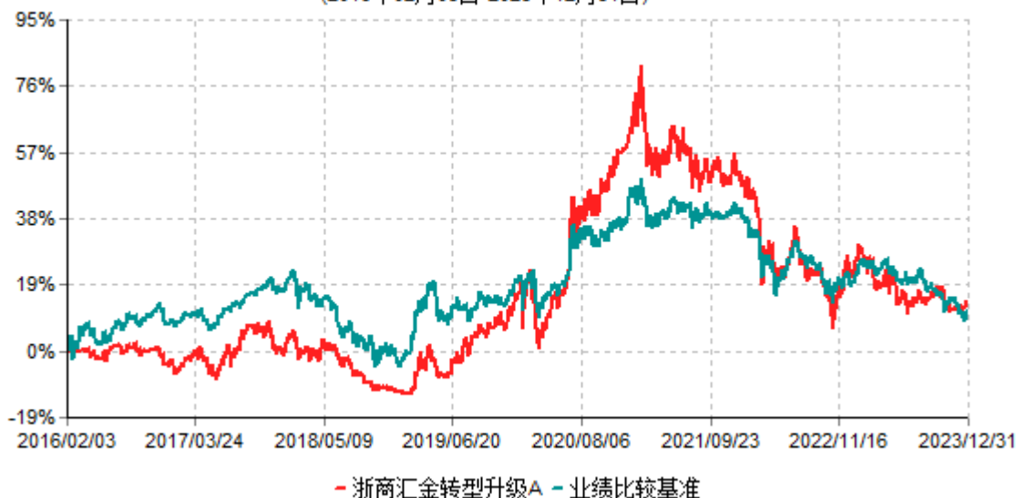
浙商汇金转型升级A累计净值增长率与业绩比较基准收益率历史走势对比图 (2016年02月03日-2023年12月31日)