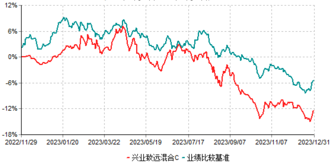
兴业致远混合C累计净值增长率与业绩比较基准收益率历史走势对比图 (2022年11月29日-2023年12月31日)

注：本基金基金合同于2022年11月29日生效，根据本基金基金合同规定，本基金自基金合同生效之日起六个月内已使基金的投资组合比例符合基金合同的约定。