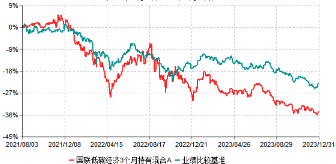
国联低碳经济3个月持有混合A累计净值增长率与业绩比较基准收益率历史走势对比图 (2021年08月03日-2023年12月31日)