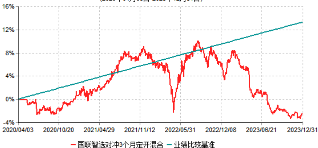
国联智选对冲策略3个月定期开放灵活配置混合型发起式证券投资基金累计净值增长率与业绩比较基准收益率历史走势对比图 (2020年04月03日-2023年12月31日)

注：按基金合同和招募说明书的约定，本基金自基金合同生效日起6个月内为建仓期，建仓期结束时本基金的各项投资比例符合基金合同的有关约定。