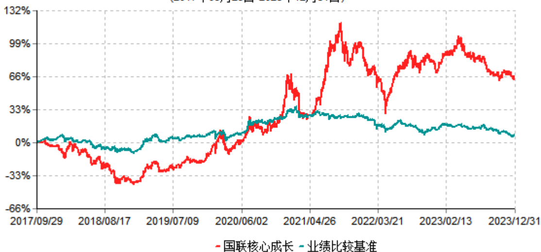
国联核心成长灵活配置混合型证券投资基金累计净值增长率与业绩比较基准收益率历史走势对比图 (2017年09月29日-2023年12月31日)

注：按基金合同和招募说明书的约定，本基金自基金合同生效日起6个月内为建仓期，建仓期结束时本基金的各项投资比例符合基金合同的有关约定。