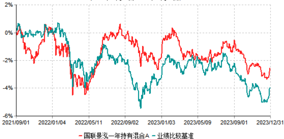
国联景泓一年持有混合A累计净值增长率与业绩比较基准收益率历史走势对比图 (2021年09月01日-2023年12月31日)