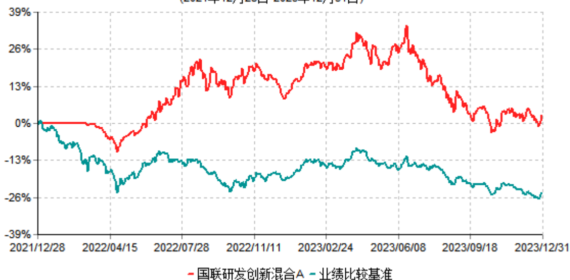
国联研发创新混合A累计净值增长率与业绩比较基准收益率历史走势对比图 (2021年12月28日-2023年12月31日)