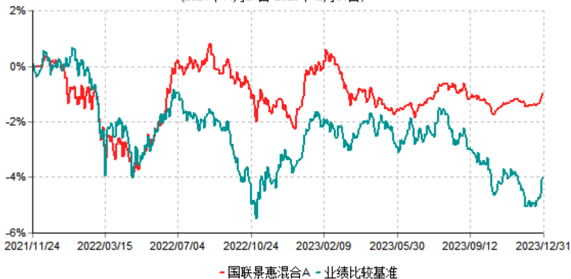
国联景惠混合A累计净值增长率与业绩比较基准收益率历史走势对比图 (2021年11月24日-2023年12月31日)