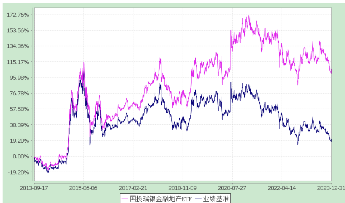
份额累计净值增长率与业绩比较基准收益率的历史走势对比图 (2013 年 9 月 17 日至 2023 年 12 月 31 日)

注：本基金建仓期为自基金合同生效日起的 3 个月。截至建仓期结束，本基金各项资产配置比例符合基金合同及招募说明书有关投资比例的约定。