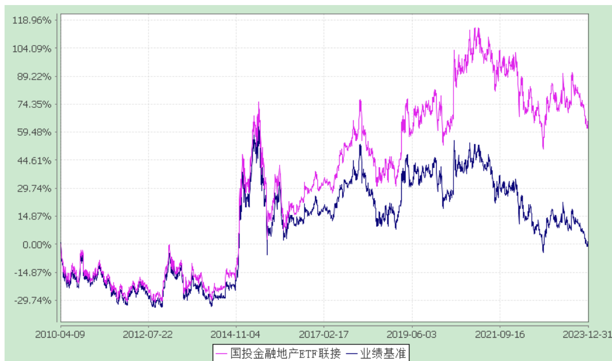
份额累计净值增长率与业绩比较基准收益率的历史走势对比图 (2010 年 4 月 9 日至 2023 年 12 月 31 日)

注：本基金建仓期为自基金合同生效日起的 3 个月。截至建仓期结束，本基金各项资产配置比例符合基金合同及招募说明书有关投资比例的约定。