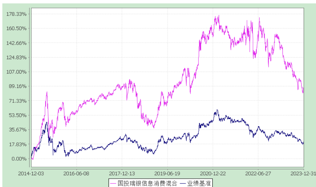
国投瑞银信息消费灵活配置混合型证券投资基金 份额累计净值增长率与业绩比较基准收益率的历史走势对比图 (2014 年 12 月 3 日至 2023 年 12 月 31 日)

注：本基金建仓期为自基金合同生效日起的 6 个月。截至建仓期结束，本基金各项资产配置比例符合基金合同及招募说明书有关投资比例的约定。