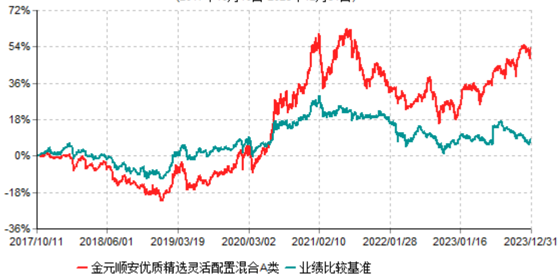
金元顺安优质精选灵活配置混合A类累计净值增长率与业绩比较基准收益率历史走势对比图 (2017年10月10日-2023年12月31日)