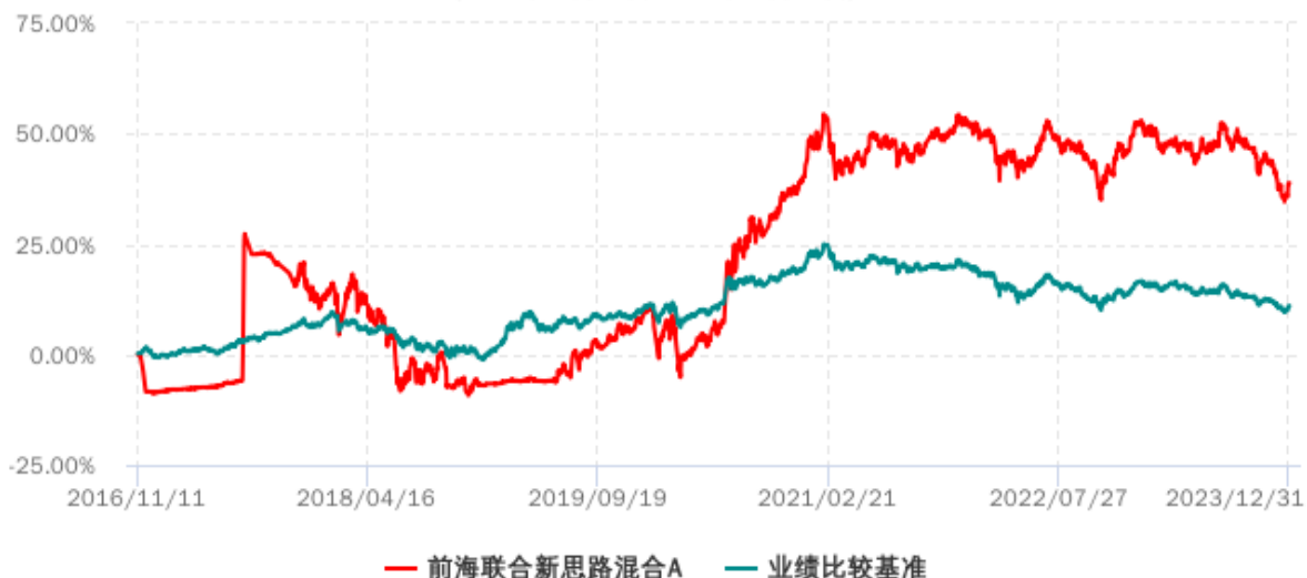
前海联合新思路混合A累计净值增长率与业绩比较基准收益率历史走势对比图 (2016年11月11日-2023年12月31日)