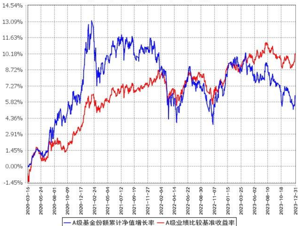
A级基金份额累计净值增长率与同期业绩比较基准收益率的历史走势对比图 (2020年3月16日至2023年12月31日)