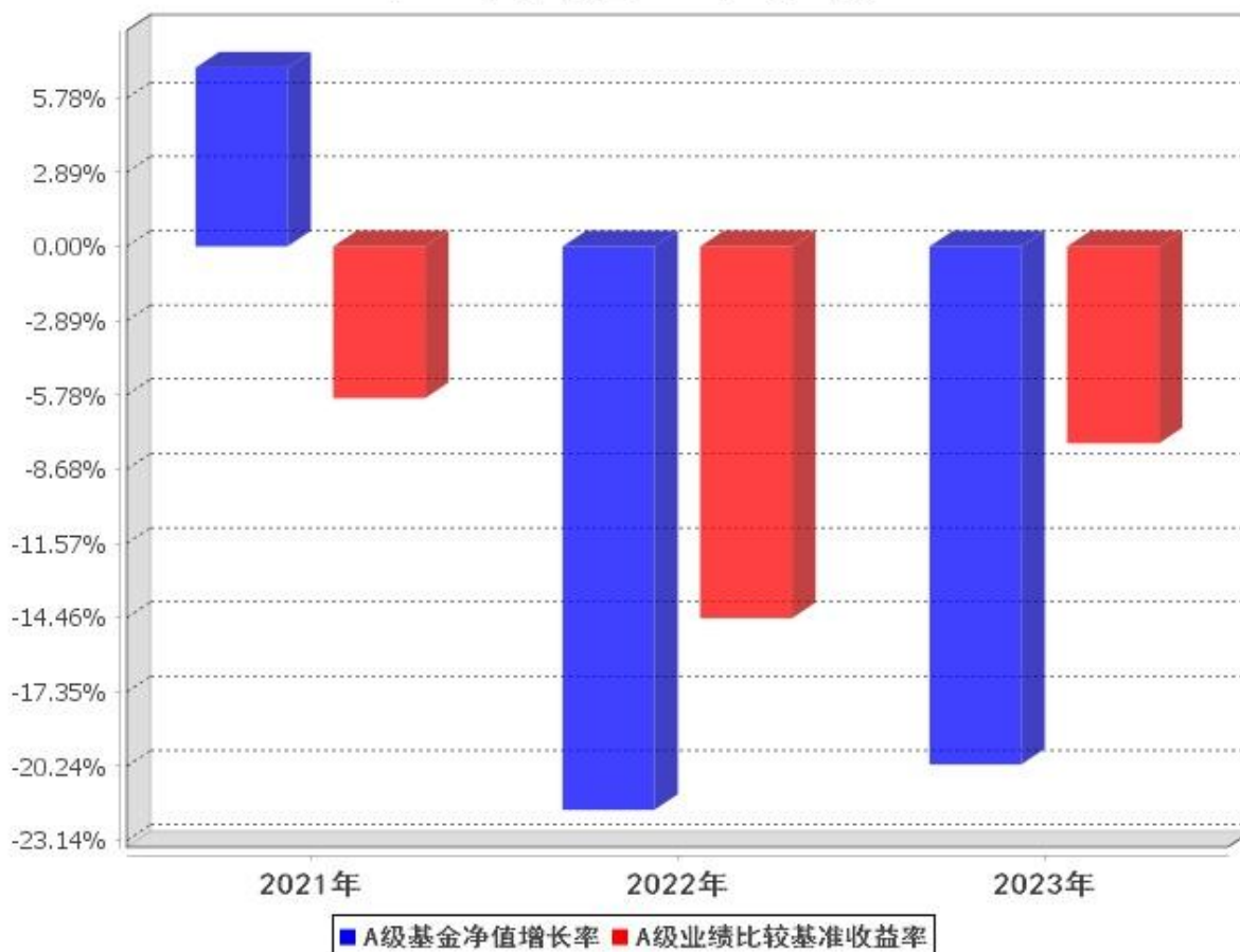
A级自基金合同生效以来基金每年净值增长率及其与同期业绩比较基准收益率的对比图 (2021年6月8日至2023年12月31日)