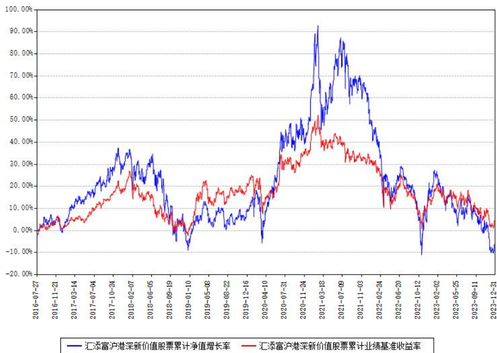
汇添富沪港深新价值股票累计净值增长率与同期业绩基准收益率对比图

注：本基金建仓期为本《基金合同》生效之日（2016年07月27日）起6个月，建仓期结束时各项资产配置比例符合合同约定。