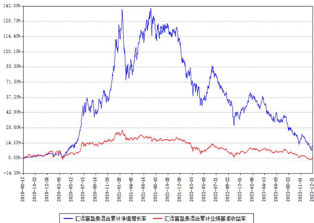
汇添富盈泰混合累计净值增长率与同期业绩基准收益率对比图

注：本基金建仓期为本《基金合同》生效之日（2019年08月13日）起6个月，建仓期结束时各项资产配置比例符合合同约定。