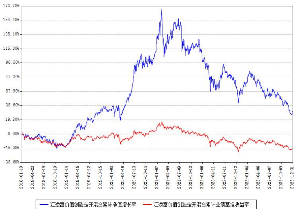
汇添富价值创造定开混合累计净值增长率与同期业绩基准收益率对比图

注：本基金建仓期为本《基金合同》生效之日（2018年01月19日）起6个月，建仓期结束时各项资产配置比例符合合同约定。