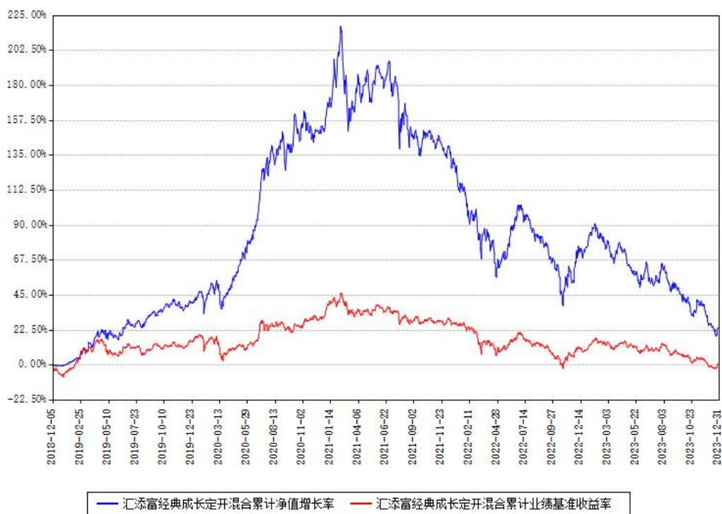
汇添富经典成长定开混合累计净值增长率与同期业绩基准收益率对比图

注：本基金建仓期为本《基金合同》生效之日（2018年12月05日）起6个月，建仓期结束时各项资产配置比例符合合同约定。