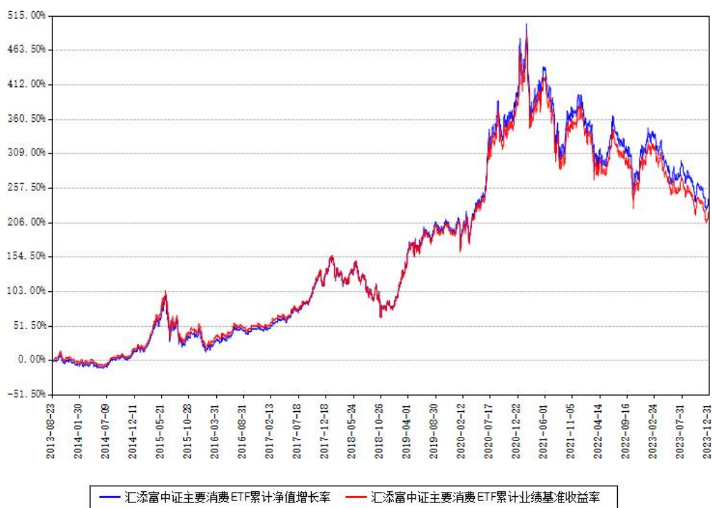
汇添富中证主要消费ETF累计净值增长率与同期业绩比较基准收益率对比图

注：本基金建仓期为本《基金合同》生效之日（2013年08月23日）起3个月，建仓期结束时各项资产配置比例符合合同约定。