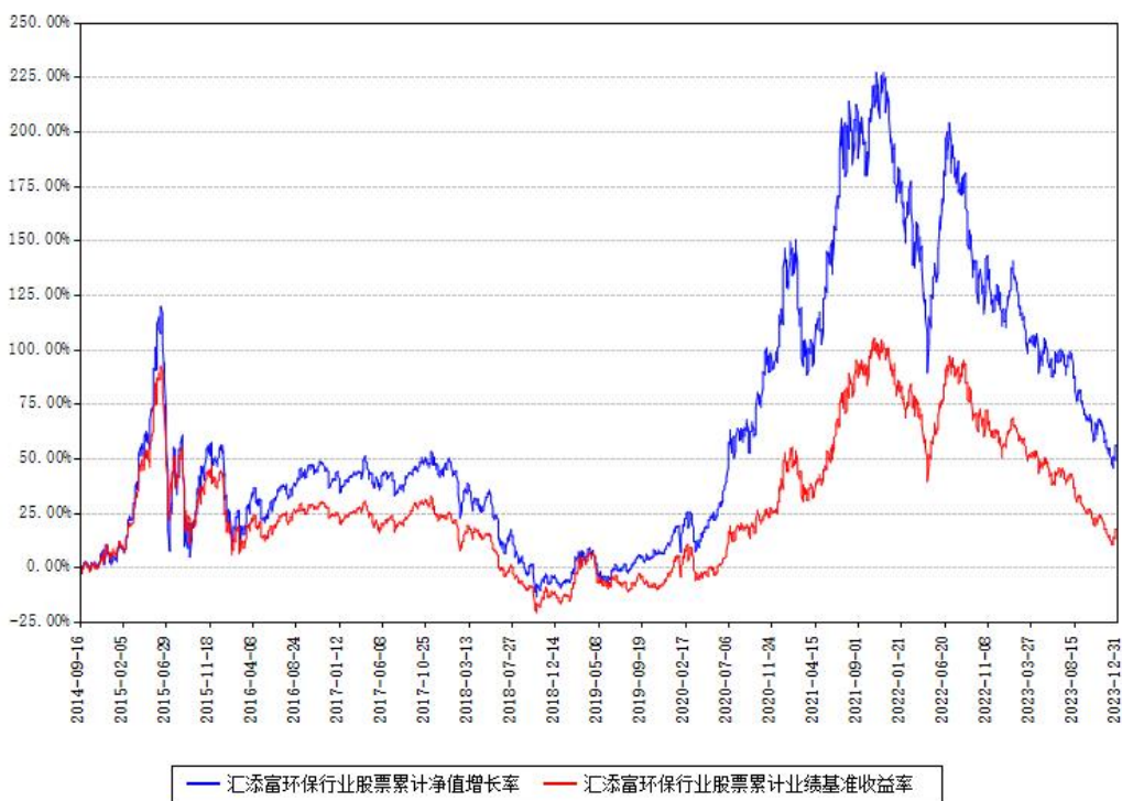
汇添富环保行业股票累计净值增长率与同期业绩基准收益率对比图

注：本基金建仓期为本《基金合同》生效之日（2014年09月16日）起6个月，建仓期结束时各项资产配置比例符合合同约定。