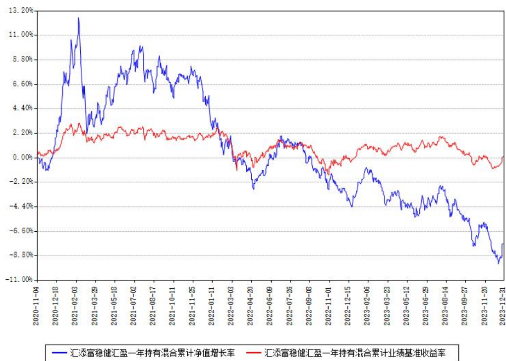
汇添富稳健汇盈一年持有混合累计净值增长率与同期业绩基准收益率对比图

注：本基金建仓期为本《基金合同》生效之日（2020年11月04日）起6个月，建仓期结束时各项资产配置比例符合合同约定。