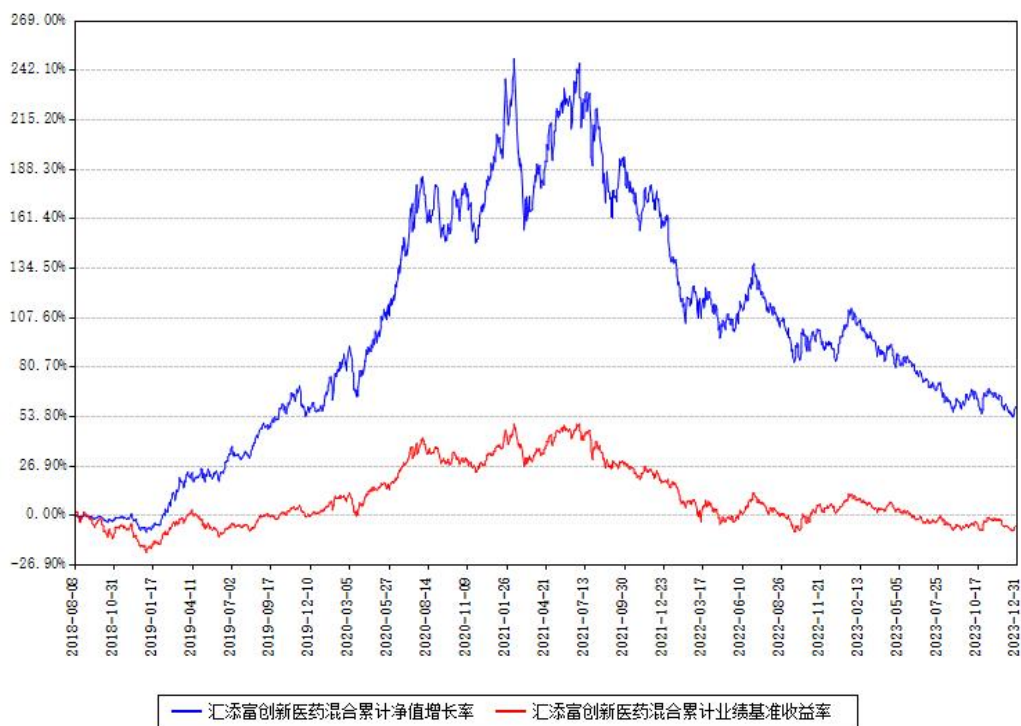
汇添富创新医药混合累计净值增长率与同期业绩比较基准收益率对比图

注：本基金建仓期为本《基金合同》生效之日（2018年08月08日）起6个月，建仓期结束时各项资产配置比例符合合同约定。