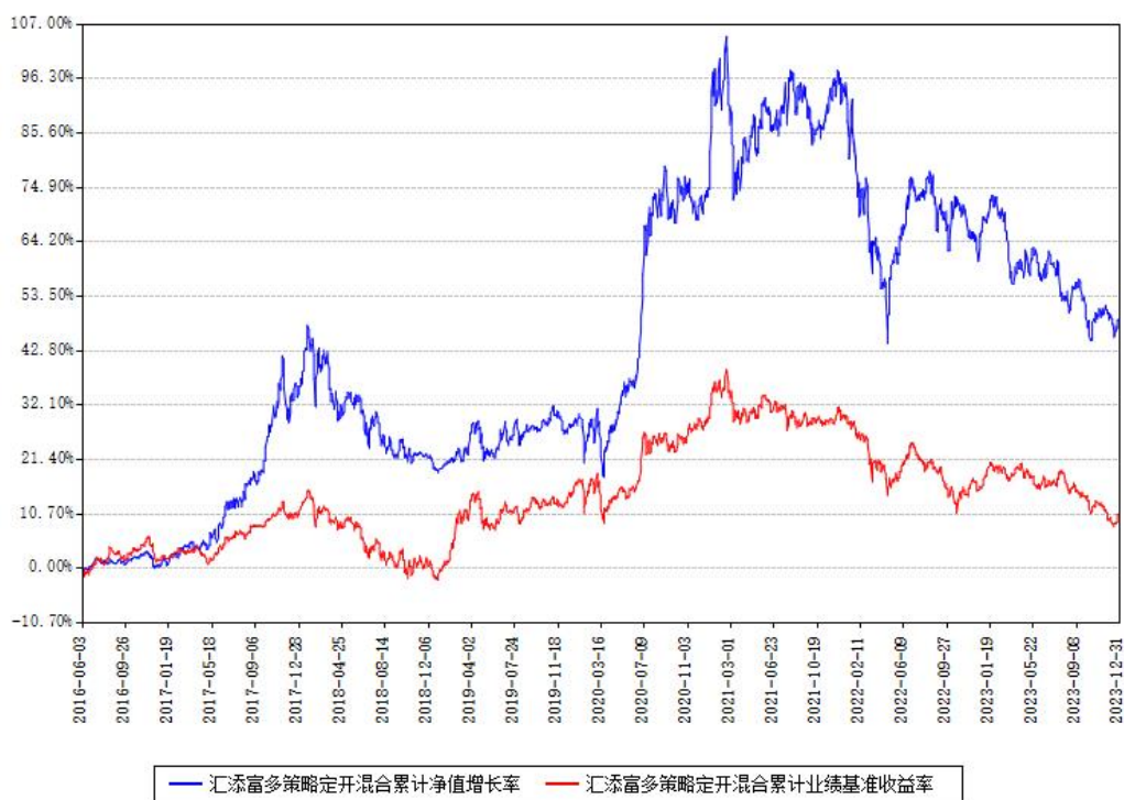
汇添富多策略定开混合累计净值增长率与同期业绩基准收益率对比图

注：本基金建仓期为本《基金合同》生效之日（2016年06月03日）起6个月，建仓期结束时各项资产配置比例符合合同约定。