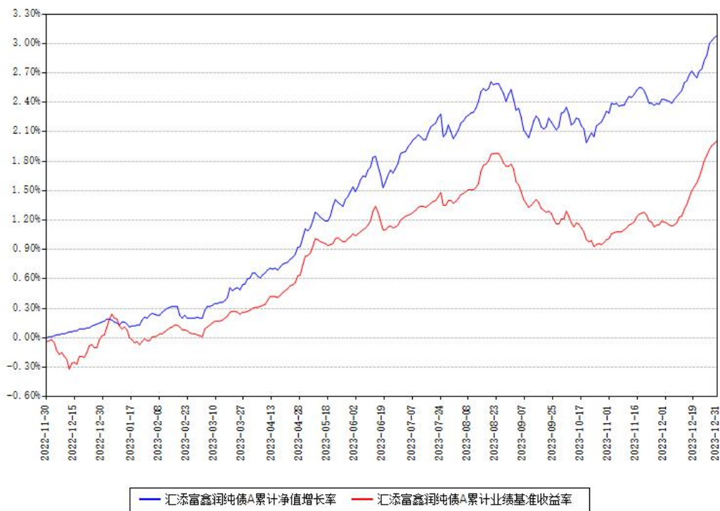
汇添富鑫润纯债A累计净值增长率与同期业绩基准收益率对比图