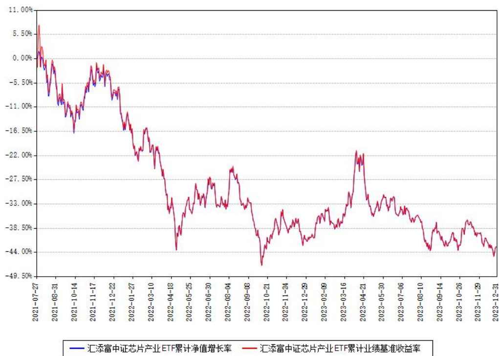
汇添富中证芯片产业ETF累计净值增长率与同期业绩比较基准收益率对比图

注：本基金建仓期为本《基金合同》生效之日（2021年07月27日）起6个月，建仓期结束时各项资产配置比例符合合同约定。