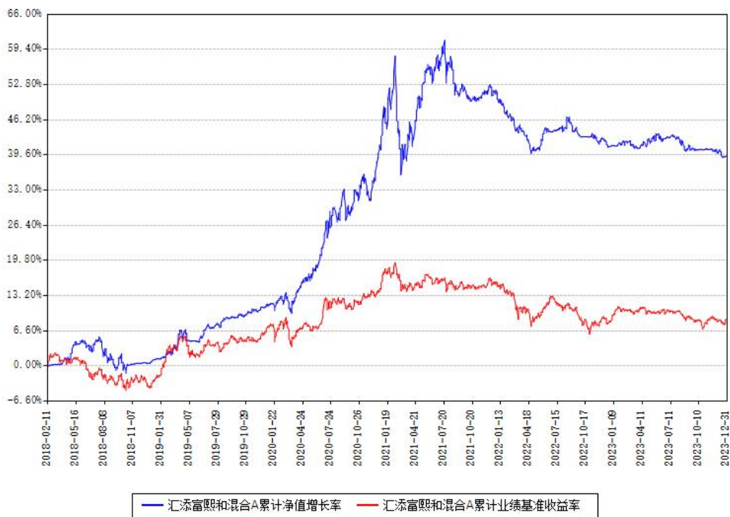
汇添富熙和混合A累计净值增长率与同期业绩比较基准收益率对比图