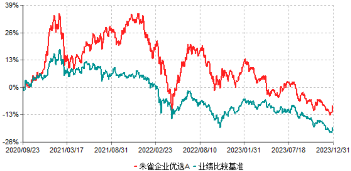
朱雀企业优选A累计净值增长率与业绩比较基准收益率历史走势对比图 (2020年09月23日-2023年12月31日)