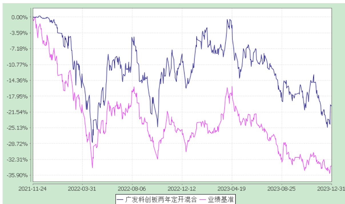
广发科创板两年定期开放混合型证券投资基金 份额累计净值增长率与业绩比较基准收益率的历史走势对比图 (2021 年 11 月 24 日至 2023 年 12 月 31 日)