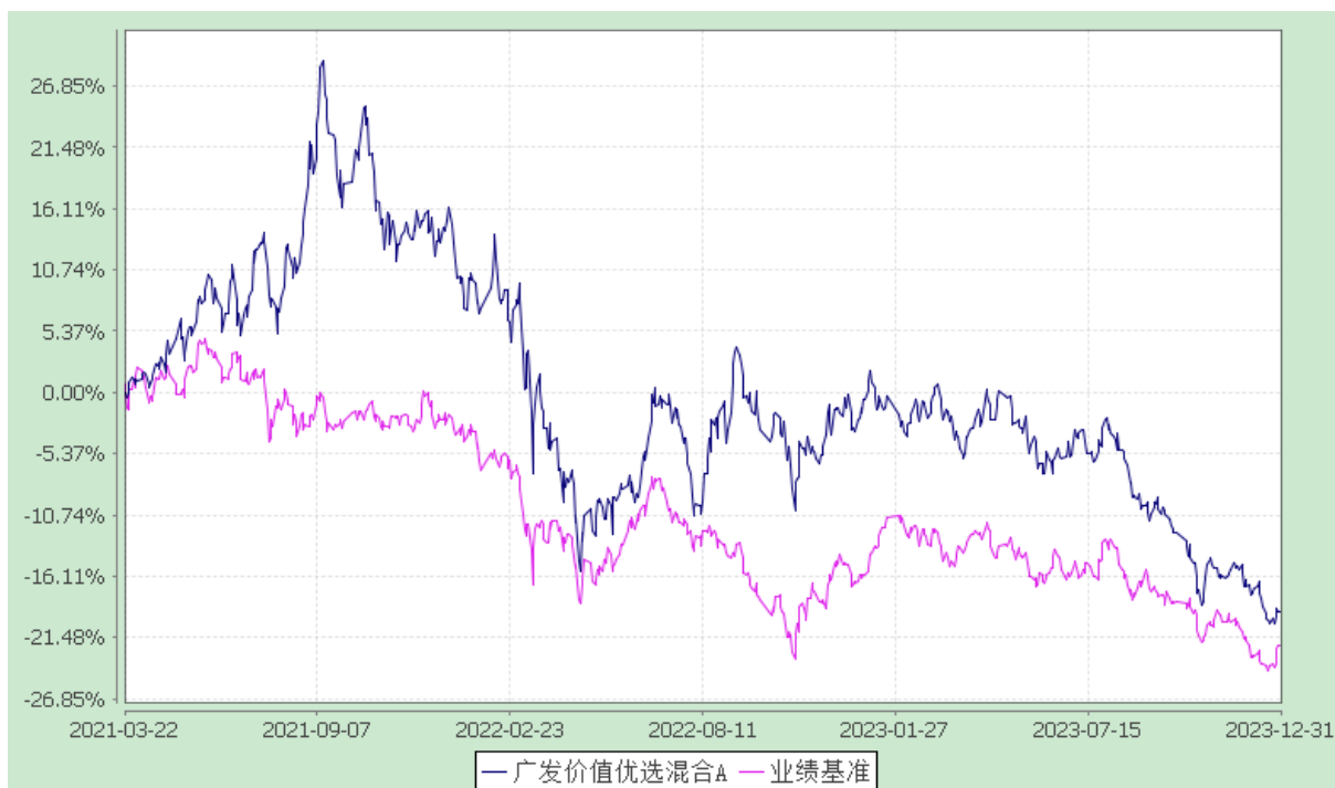
广发价值优选混合 C