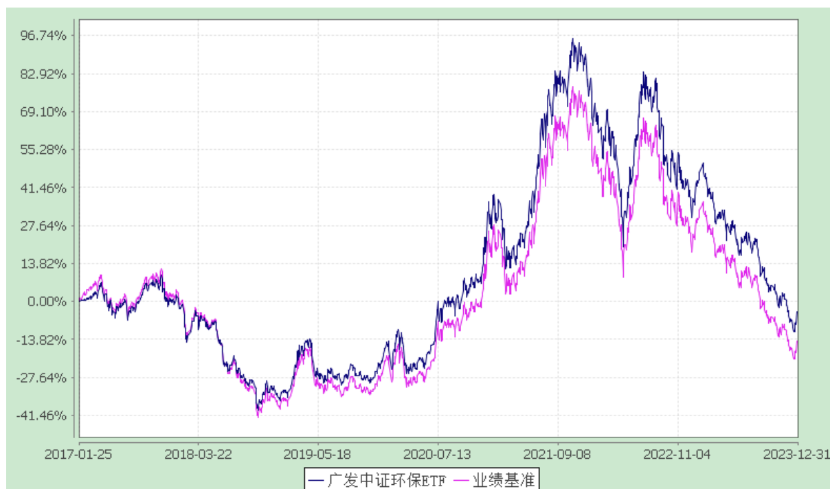
广发中证环保产业交易型开放式指数证券投资基金 份额累计净值增长率与业绩比较基准收益率的历史走势对比图 (2017年1月25日至2023年12月31日)