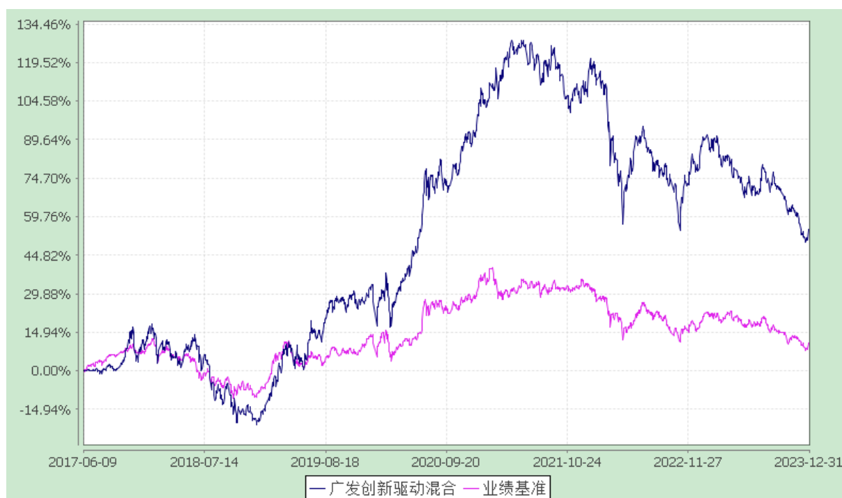
广发创新驱动灵活配置混合型证券投资基金 份额累计净值增长率与业绩比较基准收益率的历史走势对比图 (2017年6月9日至2023年12月31日)