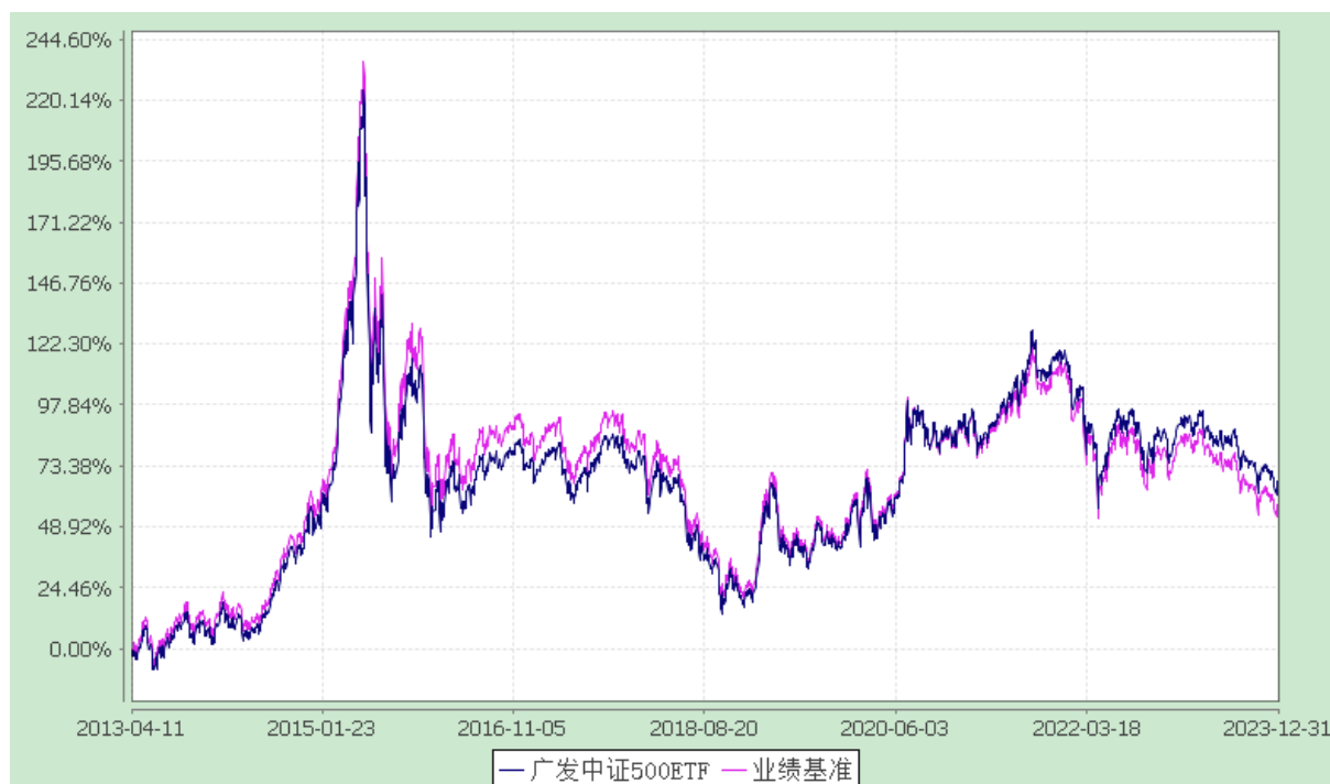
广发中证 500 交易型开放式指数证券投资基金 份额累计净值增长率与业绩比较基准收益率的历史走势对比图 (2013 年 4 月 11 日至 2023 年 12 月 31 日)