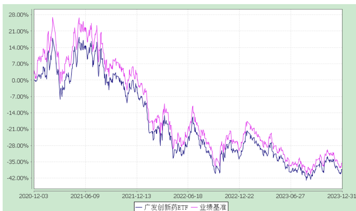
广发中证创新药产业交易型开放式指数证券投资基金 份额累计净值增长率与业绩比较基准收益率的历史走势对比图 (2020 年 12 月 3 日至 2023 年 12 月 31 日)