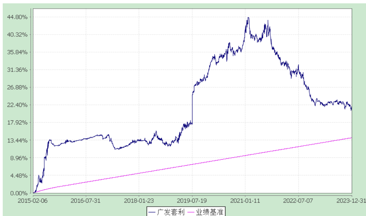
广发对冲套利定期开放混合型发起式证券投资基金 份额累计净值增长率与业绩比较基准收益率的历史走势对比图 (2015年2月6日至2023年12月31日)