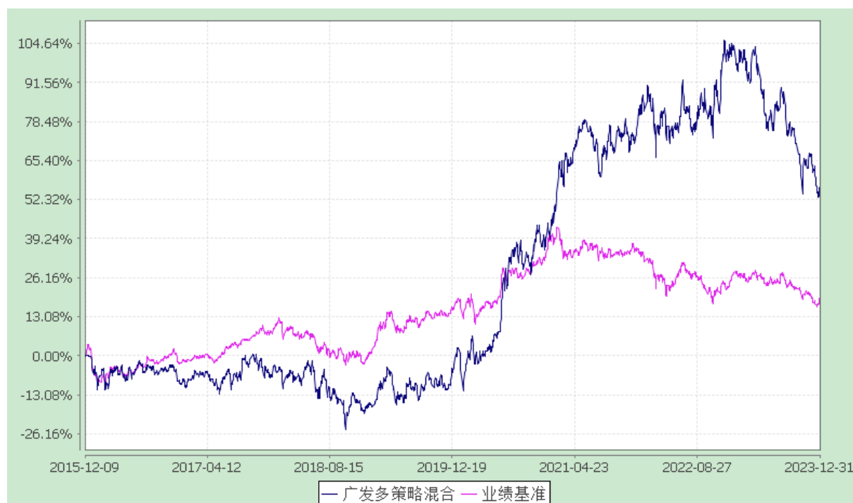
广发多策略灵活配置混合型证券投资基金 份额累计净值增长率与业绩比较基准收益率的历史走势对比图 (2015 年 12 月 9 日至 2023 年 12 月 31 日)