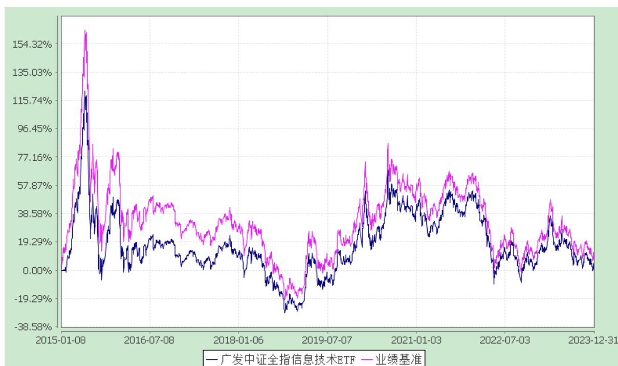
广发中证全指信息技术交易型开放式指数证券投资基金 份额累计净值增长率与业绩比较基准收益率的历史走势对比图 (2015年1月8日至2023年12月31日)