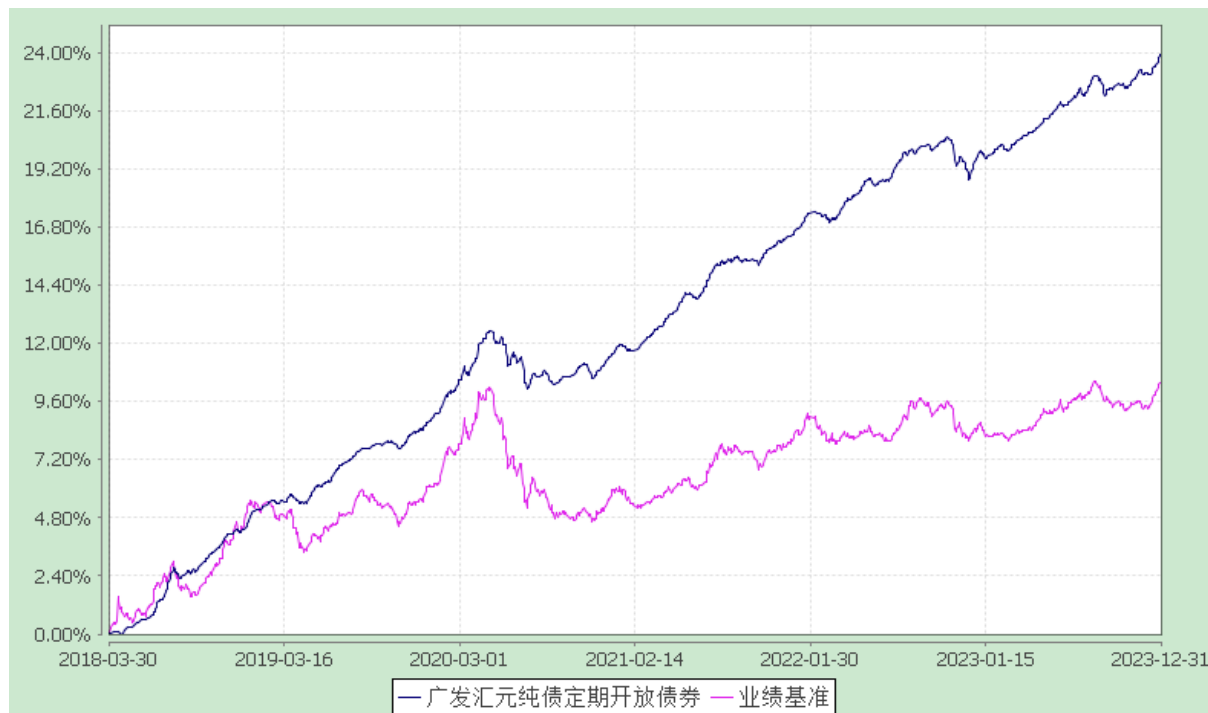
广发汇元纯债定期开放债券型发起式证券投资基金 份额累计净值增长率与业绩比较基准收益率的历史走势对比图 (2018 年 3 月 30 日至 2023 年 12 月 31 日)