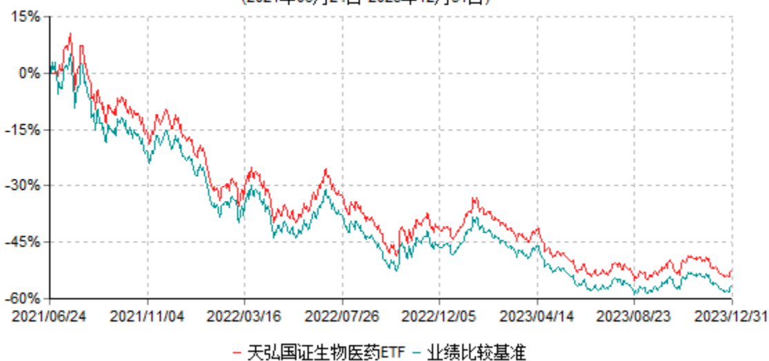
天弘国证生物医药交易型开放式指数证券投资基金累计净值增长率与业绩比较基准收益率历史走势对比图 (2021年06月24日-2023年12月31日)