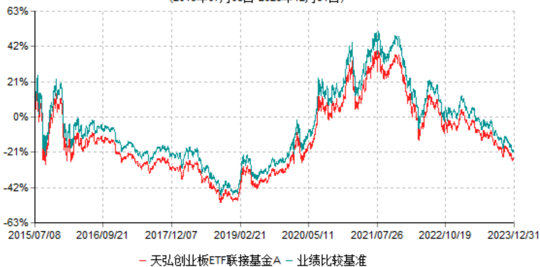
天弘创业板ETF联接基金A累计净值增长率与业绩比较基准收益率历史走势对比图 (2015年07月08日-2023年12月31日)