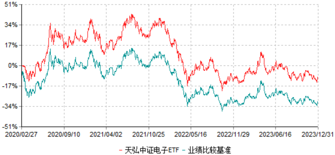
天弘中证电子交易型开放式指数证券投资基金累计净值增长率与业绩比较基准收益率历史走势对比图 (2020年02月27日-2023年12月31日)

注：1、本基金合同于2020年02月27日生效。 2、本报告期内，本基金的各项投资比例达到基金合同约定的各项比例要求。