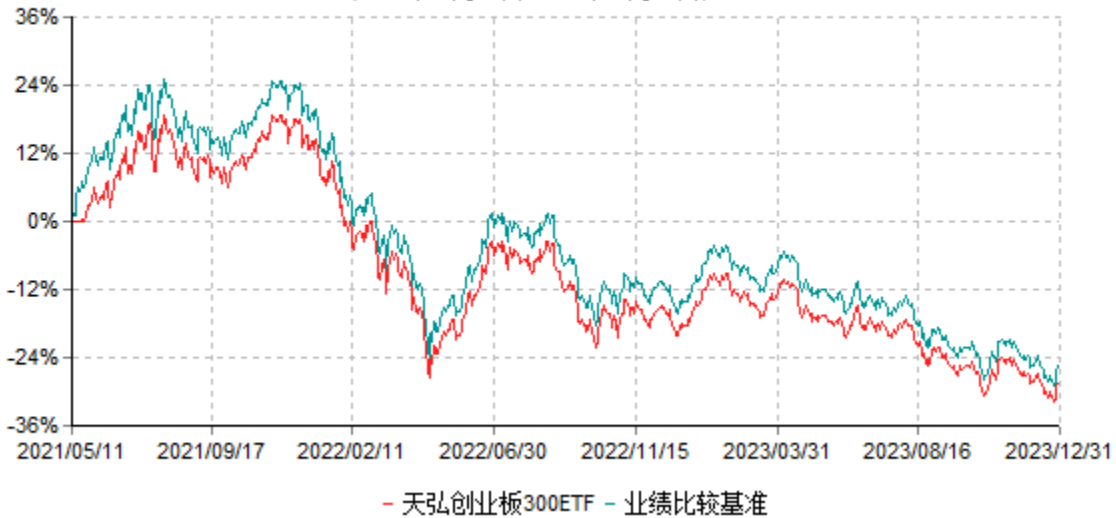
天弘创业板300交易型开放式指数证券投资基金累计净值增长率与业绩比较基准收益率历史 走势对比图 (2021年05月11日-2023年12月31日)