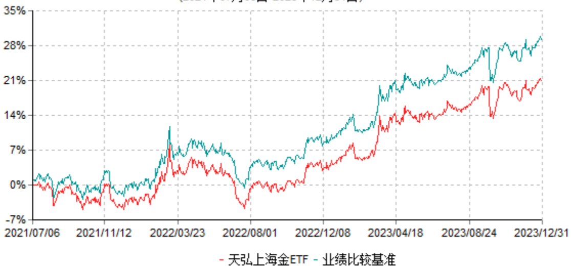
天弘上海金交易型开放式证券投资基金累计净值增长率与业绩比较基准收益率历史走势对比图 (2021年07月06日-2023年12月31日)