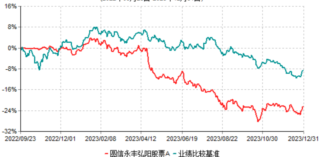
圆信永丰弘阳股票A累计净值增长率与业绩比较基准收益率历史走势对比图 (2022年09月23日-2023年12月31日)

注：自基金合同生效后，截止报告期末，本基金成立已满一年；本基金已完成建仓但报告期末距建仓结束不满一年，建仓结束时各项资产配置比例符合合同约定。