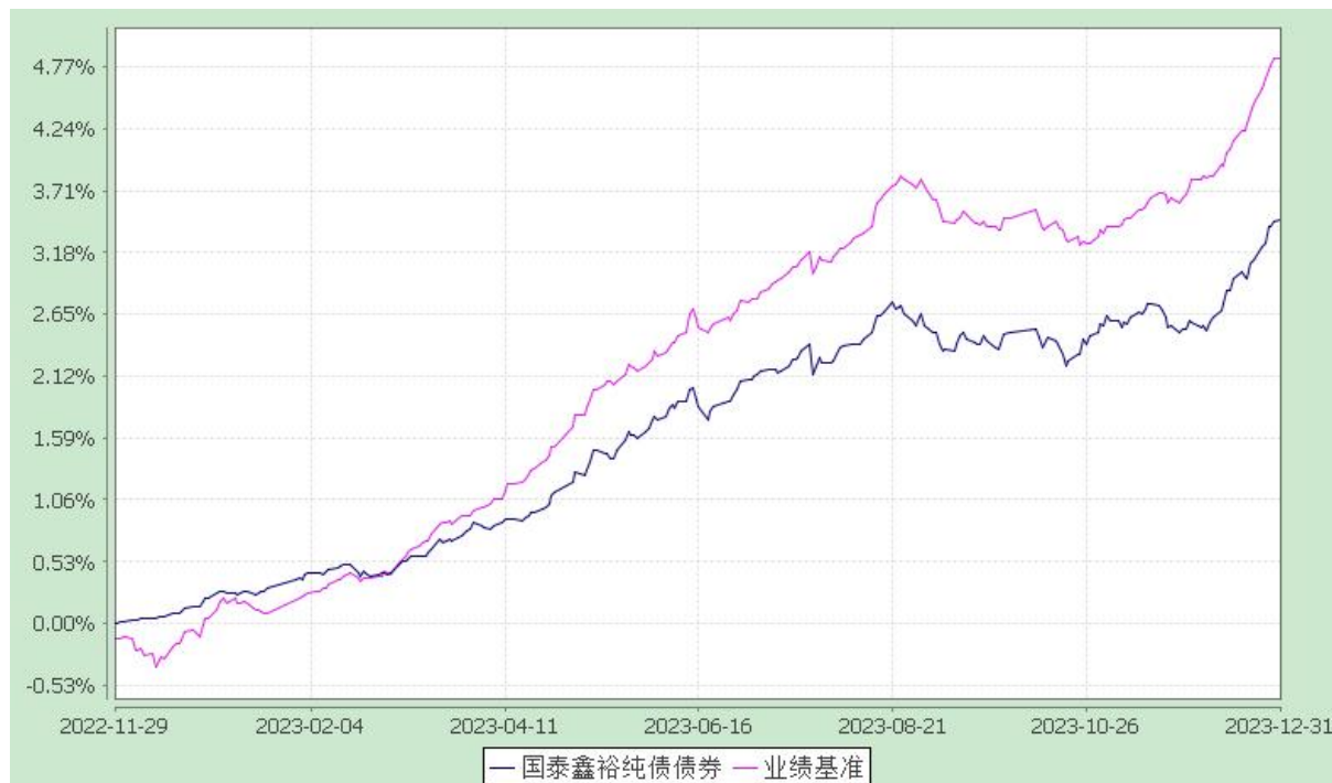
自基金合同生效以来份额累计净值增长率与业绩比较基准收益率的历史走势对比图 (2022 年 11 月 29 日至 2023 年 12 月 31 日)

注：本基金合同生效日为 2022 年 11 月 29 日。本基金在六个月建仓期结束时，各项资产配置比例符合合同约定。